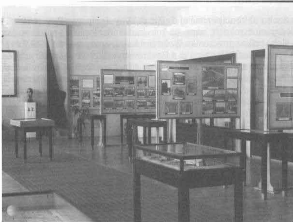
Interér výstavy Desat' rokov budovania Turca, SNM Martin. Autor: Ján Dérer, 1957