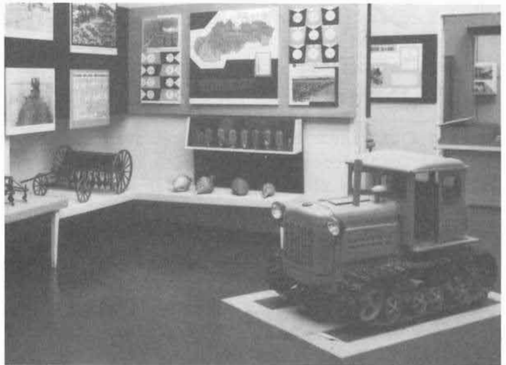
Interiér výstavy Slovenská dedina kedysi a dnes, SNM Martin. Autor: Ján Dérer, 1961