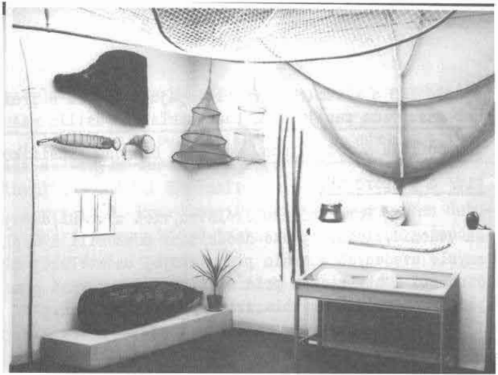
Interiér rybárskej výstavy, SNM Martin. Autor: Ján Dérer, 1957